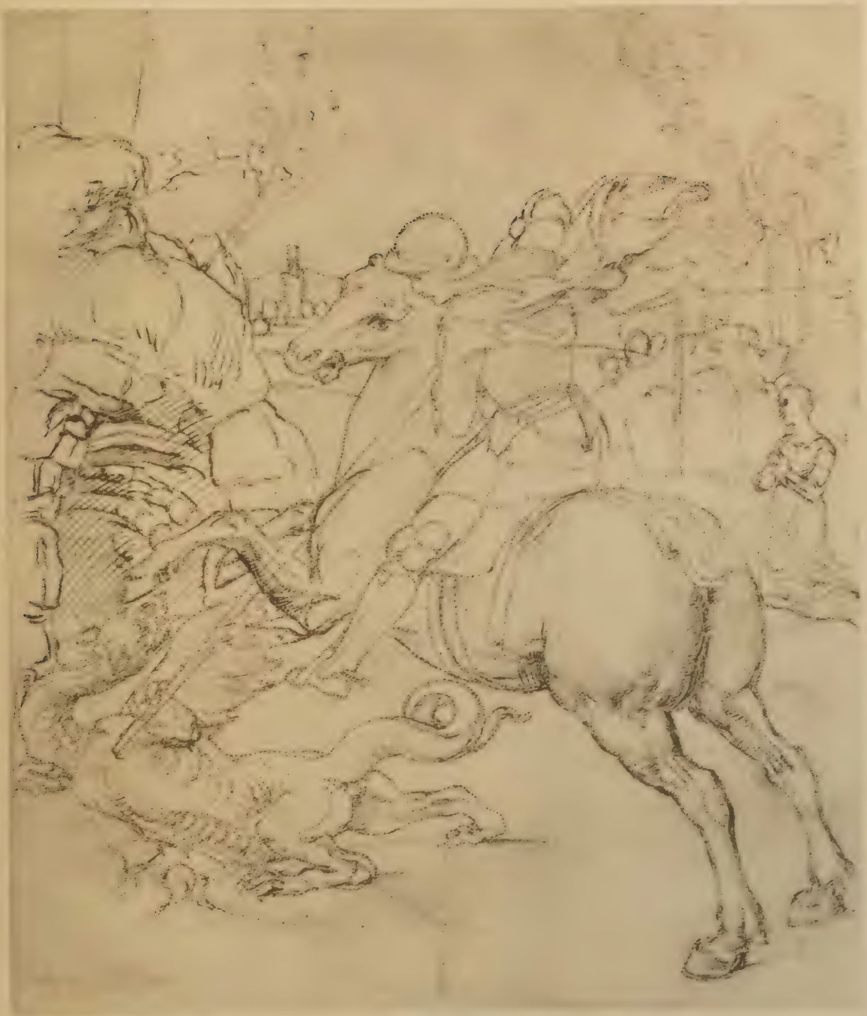
Dessin pour le Saint Georges terrassant le dragon